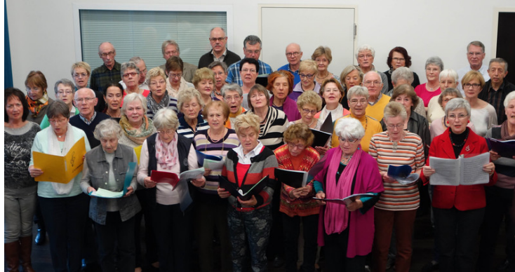
Abbildung 4: Probe des Seniorenchores

das Musikschulgebäude von Senioren auch vormittags genutzt werden, wenn Kinder und Jugendliche noch zur Schule gehen. Die Entwicklung des Bereichs als Praxisfeld ist auch mit der Zielvorstellung des generationenübergreifenden Musizierens verbunden. Musizierformen zu entwickeln, die sowohl für Kinder, Jugendliche, Erwachsene und Senioren attraktiv sind, ist die nächste Herausforderung.