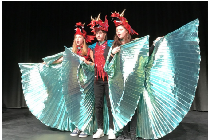
Abbildung 3: Szene aus dem Musical Elavia 2017

und einem eigenen Finanzbudget. In diesem vollständig entwickelten Praxisfeld verfügen die Beteiligten auch über zahlreiche schriftliche Unterlagen zur Vergabe von Kompositionsaufträgen, zur Ablauf- und Finanzplanung, haben langfristige Zeitstrukturen im Blick, eine Anbindung an die Schulleitung durch die Rolle des stellvertretenden Musikschulleiters als Produzent, und verbinden die Monheimer Praxis auch nach außen wie mit dem Wettbewerb Jugend Musiziert in der Sparte Musical.