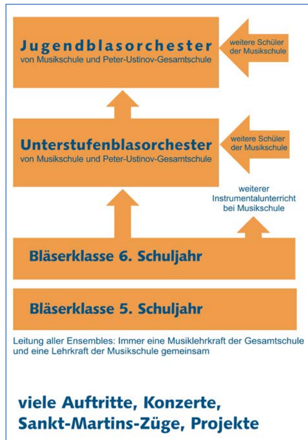
Abbildung 2: Das gemeinsam mit der Peter-Ustinov-Gesamtschule aufgebaute Praxisfeld Bläserklassen-Blasorchester

abgeschlossen ist, aber innerhalb derer sich die handelnden Lehrkräfte und Schüler bereits sicher bewegen können. Dabei überschneidet sich die Funktion des Unterstufenblasorchesters mit dem Praxisfeld „Grundschulorchester, fachdidaktische Anfängerorchester“, S. 22. Das Jugendblasorchester hat in verschiedenen Konzerten der Vergangenheit bewiesen, dass es wegen seines hohen Niveaus und anspruchsvoller Literatur auch für Repräsentationszwecke geeignet ist.