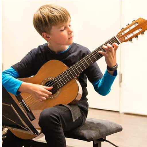
Abbildung 1: Junger Gitarrist im Konzert der Begabtenförderung

Im weiteren Sinne zur der Begabtenförderung gehörig ist auch die „Studienvorbereitende Ausbildung“ (SVA) der Musikschule. Hier ist eine statt eines Wettbewerbs eine regelmäßige Prüfung zur Teilnahme erforderlich, die Bewertungskriterien liegen jedoch nicht in einer persönlichen Begabung des Schülers, sondern in den Aufnahmebedingungen der verschiedenen Studiengänge im Bereich Musik.